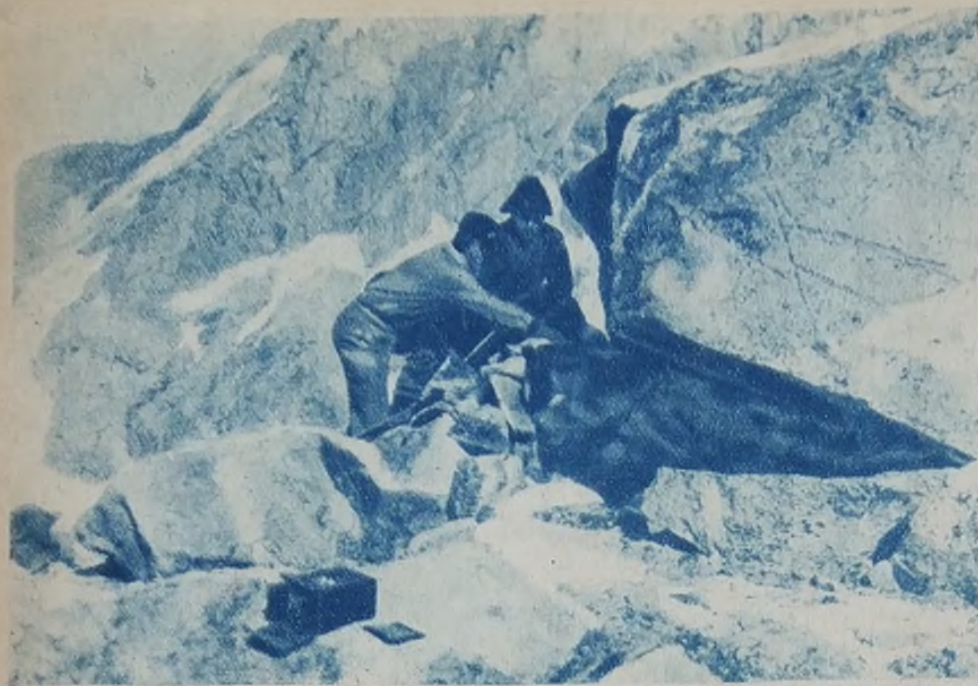
На главной вершине Мунку-Сардык

вечные снега. Еще через 3-4 часа поднялись по морене на замыкающую долину стену, и перед нами выросла вершина Мунку-Сардык. У языка ледника лежало небольшое почти круглое озеро, покрытое льдом. На берегу этого озера остановились на ночлег. До ночовки решили выйти на разведку. Сначала поднимались спокойно, потом, когда место стало походить на описание Перетолчина, наши движения ускорились, мы быстро скакали с камня на камень и напряженно всматривались во всякое случайное нагромождение камней. От подъема и ожидания сердце билось вдвое быстрее. Мы шли, как кладовщики у заветного места, и вдруг все одновременно увидели груды камней, сложенную человеческой рукой. Пройти мимо, не заметив груды, было невозможно. Сняли верхние камни и увидели длинный металлический цилиндр, должно быть термометра. Открыли дверцу футляра, и термометр впервые более чем за 30 лет увидел свет.